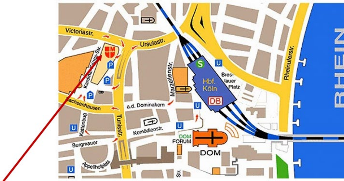
LAGEPLAN B: Erzbischöfliche Diözesan- und Dombibliothek Köln (EDDB)

Für die Führung wird eine Tischvorlage bereits am Vor-, i.e. dem 09.10.2025 als erstem Tagungstag im sog. ‚Neuen‘ Seminargebäude der Universität zu Köln, erneut vor ihrem Beginn in situ vorgehalten werden; nehmen Sie gern bereits im Voraus ein Exemplar an sich.