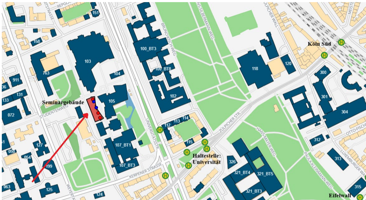
LAGEPLAN A: sog. „Neues“ Seminargebäude der Universität zu Köln

Gepäckstücke können kostenlos – es wird keine eigenständige Garderobe eingerichtet werden – in Schließfächern , i.e. dem Erdgeschoss des linken Gebäudeflügels vor Raum S01 deponiert werden; folgen Sie hier der Beschilderung in situ .